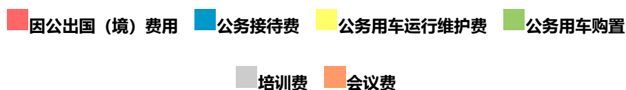
图 3、“三公”经费、培训费、会议费支出预算构成